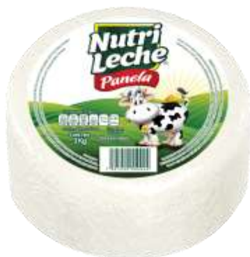
Queso Panela Nutri Leche 3kg