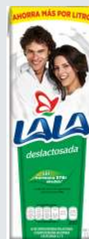
Leche UHT Deslactosada 1.5L