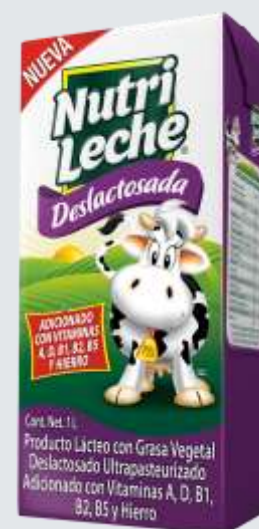
Nutri Leche UHT Deslactosada 1L

Caja de 6,263 mdp al 30 de septiembre, 2016