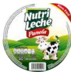
Queso Panela Nutri Leche 450g